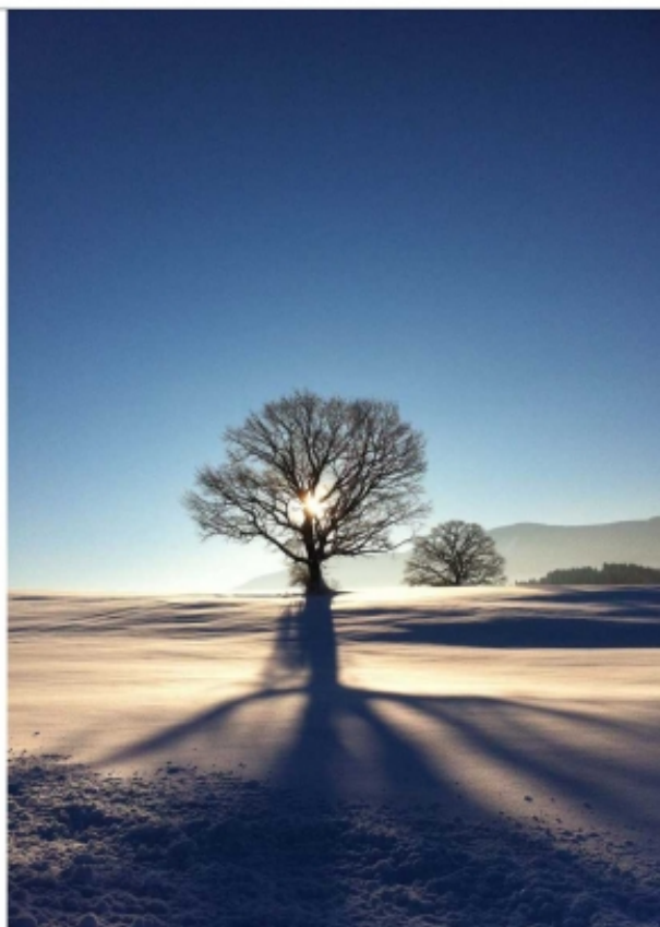
1. 1. 2015 Auf der Egg Bestattungen Niggli Lechbruck