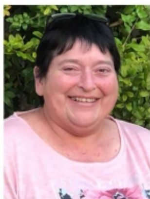
Roßhaupten, Altisried im Oktober 2020

Manchmal bist du in unseren Träumen, oft in unseren Gedanken, immer in unserer Mitte, für ewig in unseren Herzen.