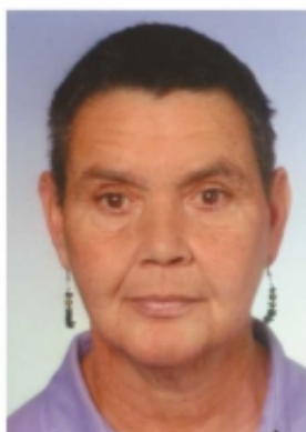
Lechbruck, Altstadt im Juli 2021

Trauert nicht um mich! Ihr habt mich nicht verloren, ich bin euch nur vorangegangen während ihr noch etwas zurück bleibt. Am Ziele erwarte ich euch. Ich sterbe, aber meine Liebe zu euch stirbt nicht! Ich werde euch vom Himmel aus lieben, wie ich es auf Erden getan.