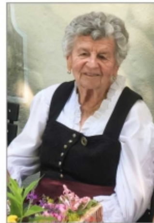
Steingaden, im Mai 2020

Die Beisetzung findet im engsten Familienkreis statt.