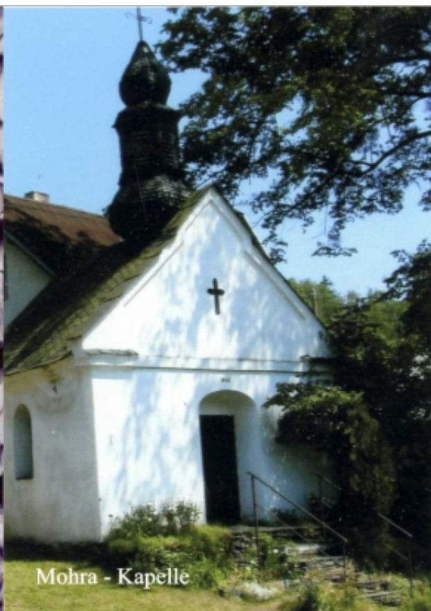
Mohra - Kapelle