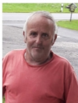
Sulzberg, im März 2022

Zufrieden sein ist große Kunst, zufrieden scheinen blasser Dunst, zufrieden werden großes Glück, zufrieden bleiben Meisterstück.