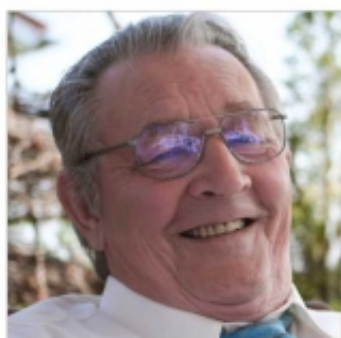
Bernbeuren, im Mai 2020

In Liebe und Dankbarkeit nehmen wir Abschied von meinem lieben Mann, unserem guten Vater, Schwiegervater und Opa