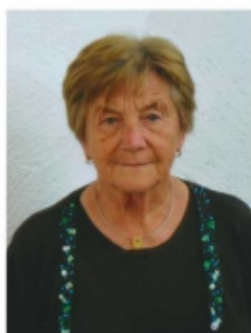
Burggen, im März 2020

Was Du im Leben hast gegeben, dafür ist jeder Dank zu klein. Du hast gesorgt für Deine Lieben, von früh bis spät, tagaus, tagein. Du warst im Leben so bescheiden, nur Pflicht und Arbeit kanntest Du. Mit allem warst Du stets zufrieden. Nun schlafe sanft in aller Ruh!