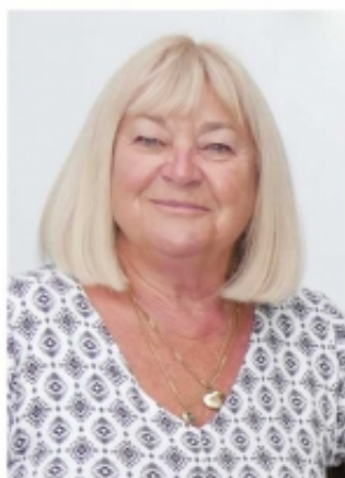
Lechbruck, München im Oktober 2020

Behaltet mich so in Erinnerung, wie ich in den schönsten Stunden meines Lebens mit euch allen zusammen war.